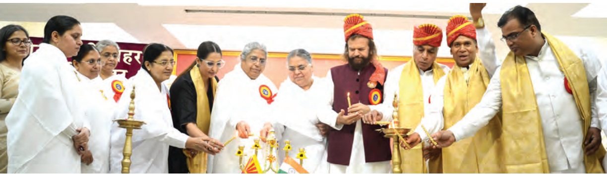
ओआरसी में आयोजित कार्यक्रम का दीप प्रज्वलित कर शुभारंभ करते अतिथि।

हर कर्म को कला के रूप से करना ही सबसे बड़ा कलाकार होना है।