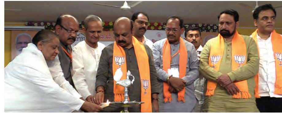
कार्यक्रम का दीप प्रज्वलन कर उद्घाटन करते मुख्यमंत्री बोम्माई एवं अन्य अतिथि।