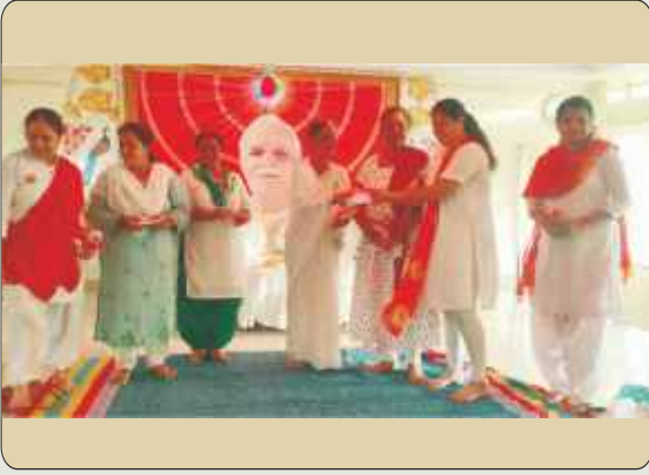
आदिपुर : आंतरराष्ट्रीय योग दिवसानिमित्त कार्यक्रमात योग शिक्षकांना ईश्वरी भेटवस्तू देताना ब्र.कु. भारती