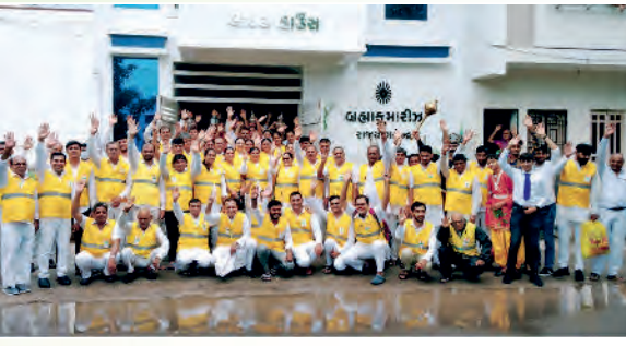
સુરત મોટા વરાછા દ્વારા ચૌઠા બજાર થી વેલંજ સુધીના વિસ્તારમાં આયોજીત 'સડક સુરક્ષા યાત્રા' અભિયાનના યાત્રીગણ.