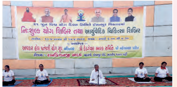
अमदावाड एसनपुर जाते 'विश्व योग दिवसे' पतंजलि योग ग्रुप, हेगडेवार स्मारक समिती द्वारा आयोजित योग शिबिरमां राजयोगानो संदेश आपतां प्र.कु. जगृतिभेन.