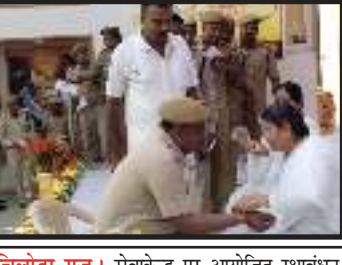
चिलोडा-गुज। सेवाकेन्द्र पर आयोजित रक्षाबंधन कार्यक्रम में जिला कमांडेंट सहित अन्य अधिकारियों एवं सौ से अधिक जवानों को रक्षासूत्र बांधा गया तथा श्रेष्ठ जीवन जीने की प्रतिज्ञा भी कराई गई।