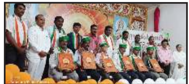
दावणगेरे-कर्नाटक । ब्रह्माकुमारीज के शिवालय सेवाकेन्द्र पर मीडिया पर्सनल्स के लिए रक्षाबंधन कार्यक्रम का आयोजन किया गया। कार्यक्रम में प्रेस रिपोर्टर्स, वीडियो जर्नलिस्ट्स, फोटोग्राफर्स तथा इस क्षेत्र से जुड़े 200 से अधिक मीडियाकर्मी शामिल रहे। सभी को ब्रह्माकुमारी बहनों द्वारा रक्षासूत्र बांधा गया।